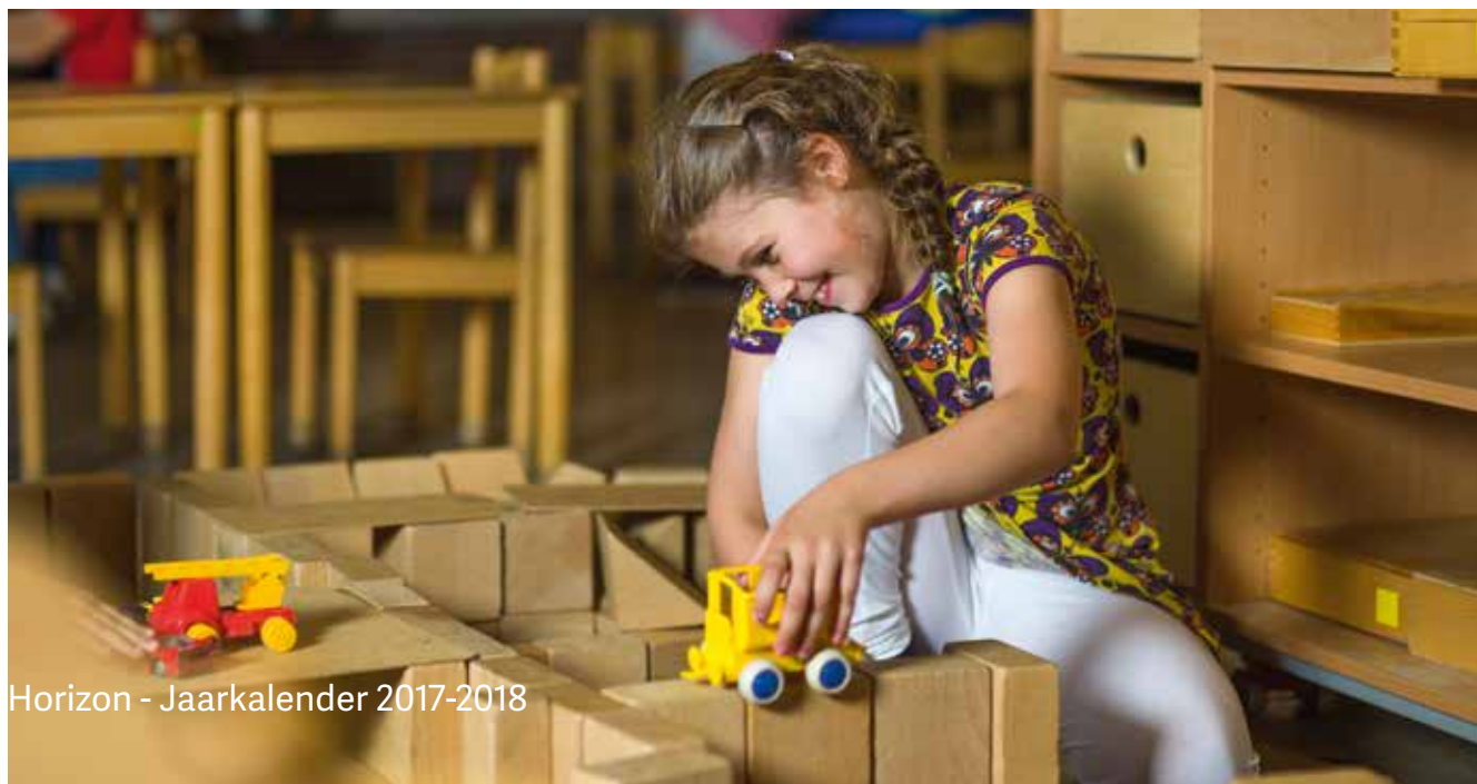
Horizon - Jaarkalender 2017-2018